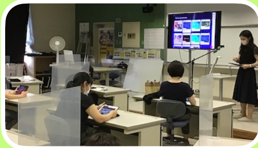
ICT活用教育推進センター研修室にて

【講座10】「2つのアプリを使うことで、色々な教材が作れることがわかってよかった。文字を書くことに困難を抱えている児童生徒もこれなら楽しんで自己表現ができそうだと思います。」「今まで使ってたClipsがこんなにも使いやすく、見やすいものとは思わなかった。」「今まで、国語の短歌や俳句、詩の学習では音読をして終わりだったので、個性的な作品を作って映像と録音で残してあげたいと思いました。」