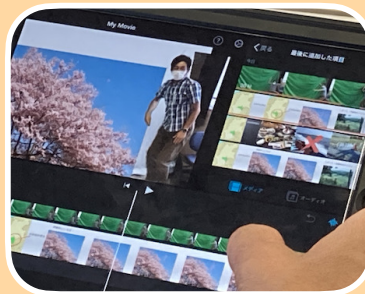
iMovieで作ってクロマキー合成

【講座8】「KeynoteとiMovieのコラボもなるほどなと感じました。新しい技術を知るとは本当に楽しいです。」「Keynoteを動画化することを知らなかったので、おおいに活用できそうだと感じました。」「iMovieで動画の編集をしたことはあったのですが、グリーンスクリーン機能など新しい機能がとても印象的でした。」「クロマキー合成は子どもが喜んでいい作品を作りそうな気がします。」「こんなステキな動画ができるなんて、感激です。やらないと忘れてしまうので、またゆっくり作ってみたいです。」