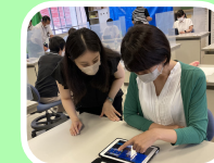
授業の中でも活用場面たくさん

今回、都合により参加されできなかった先生方から「研修内容について知りたいが？」という問い合わせをたくさんいただきました。研修ビデオと研修で使われた資料を、「ICT活用教材DB」内の「09夏季研修会資料」内に講座毎、入れてありますのでご利用ください。