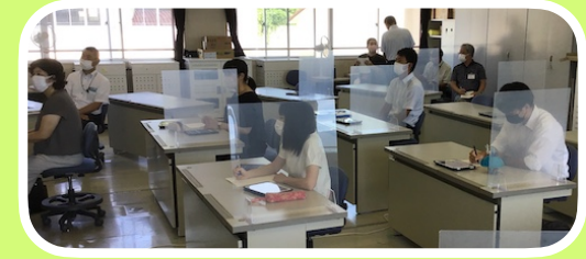
コードタクトのメンバーもオンラインで参加して研修

【講座3～6】伊那市のスクールタクトの活用した実践は全国レベルのものになっています。伊那市で実践交流することが最高の研修と言って良いでしょう。コードタクトの皆さんと共により質の高い研修が今後も展開されていきます。