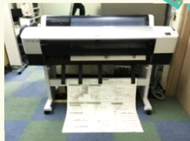
大判プリント利用料金表